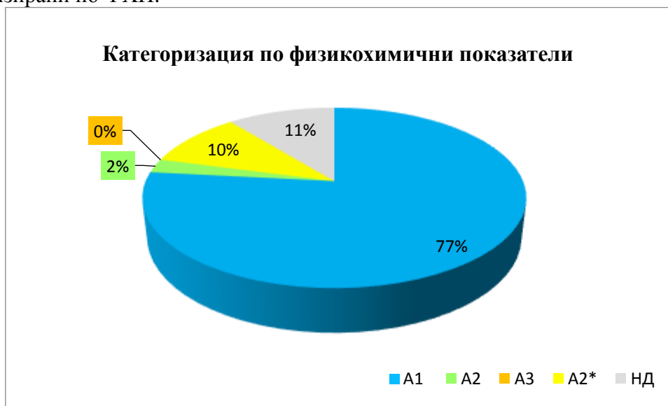
Фиг. 1 Категоризация по ФХП за 2017 г. в проценти от общия брой

За 13 водоизточника не са получени данни от мониторинг на ФХП и същите не са категоризирани по ФХП.