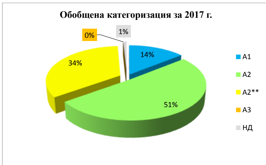
Фиг. 3 Обобщена категоризация на повърхностни води, предназначени за ПБВ на територията на ДРБУ за 2017 г. в проценти от общия брой