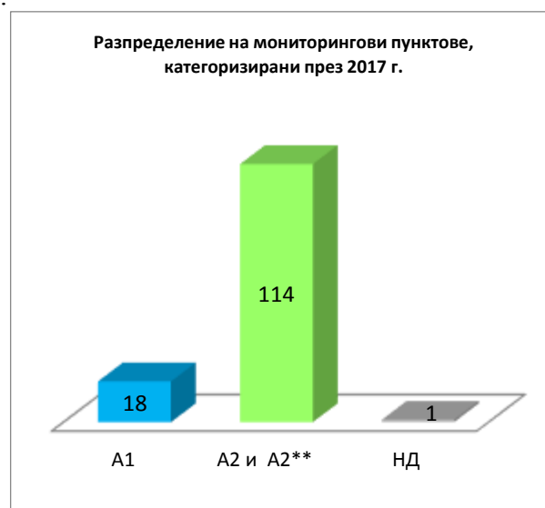
Фиг.5 Категоризация 2017г.