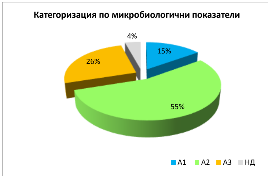
Фиг. 2 Категоризация по МБП за 2017 г. в проценти от общия брой