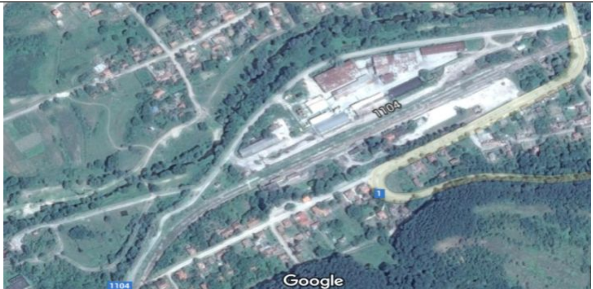
Снимка от Google на района на промишленото предприятие, заради което този РЗПРН е определен с висок риск