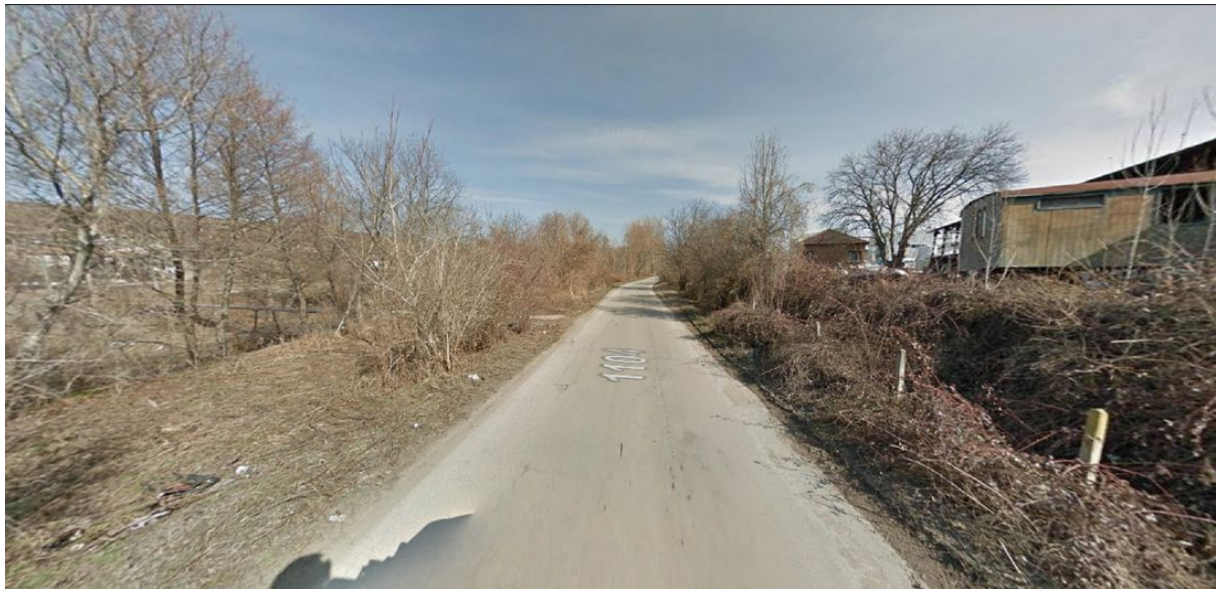
Снимка от Google street view на района на промишленото предприятие (реката е вляво), а площадката на промишленото предприятие - вдясно

От тези снимки се вижда, че районът на промишленото предприятие е разположен 2 до 4 метра по-високо от реката. Вероятно при дъждове с малка интензивност, промишлено предприятие не се наводнява, но само този снимков материал не може да потвърди или отрече заключенията на ПОРН за заливаемост на площадката на промишленото предприятие при обезпеченост на речния отток 1%.